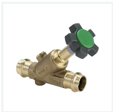
Easytop-Schrägsitzventil (Freistromventil) mit SC-Contur Modell 2237 Artikel 457 082