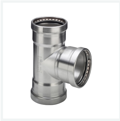
Sanpress Inox XL-T-Stück mit SC-Contur Modell 2318XL Artikel 482 770