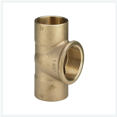
T-Stück Modell 94130G Artikel 119 195