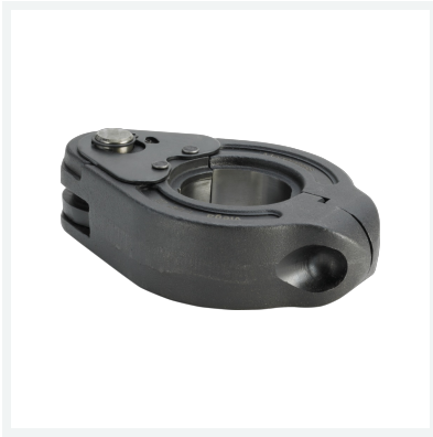
Pressring für Megapress Modell 4296.1