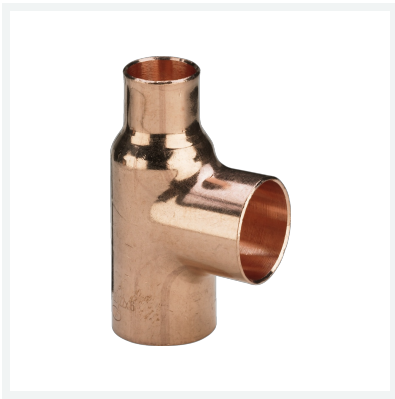
T-Stück Modell 95130 Artikel 113 711