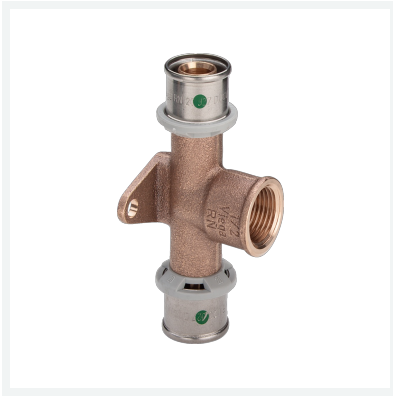
Sanfix P-Wandscheiben-T-Stück mit SC-Contur - Pressanschlüsse, Rp-Gewinde Modell 2125.8