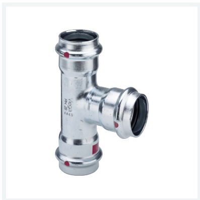
Prestabo-T-Stück mit SC-Contur Modell 1118 Artikel 558 703