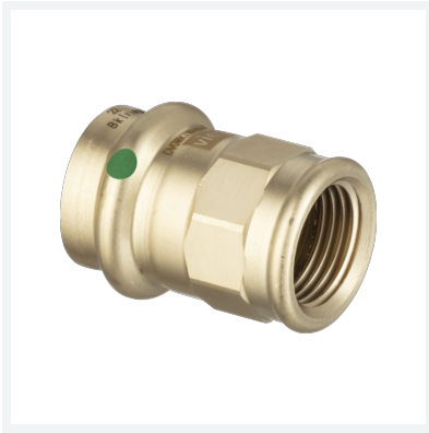
Sanpress-Übergangsstück mit SC-Contur Modell 2212 Artikel 124 236