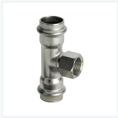
Sanpress Inox-T-Stück mit SC-Contur Modell 2317.2 Artikel 437 206