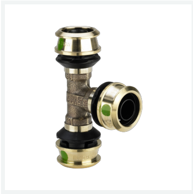
Raxofix-T-Stück mit SC-Contur Modell 5318 Artikel 647 278