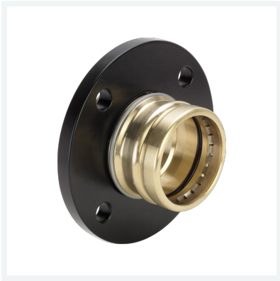
Sanpress XL-Flanschübergang mit SC-Contur Modell 2259.3XL Artikel 652 340