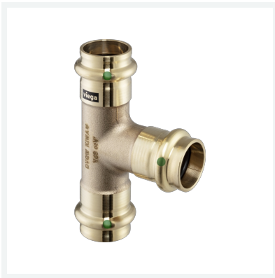
Sanpress-T-Stück mit SC-Contur Modell 2218 Artikel 111 625