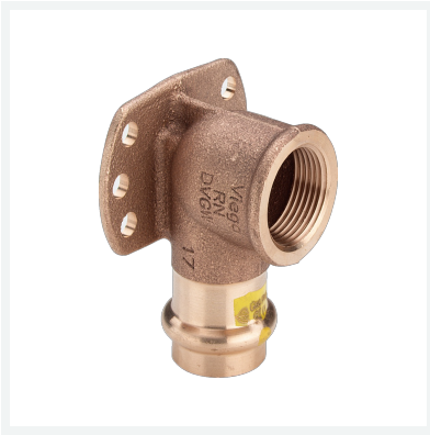
Profipress G-Wandscheibe mit SC-Contur Modell 2625.5 Artikel 346 690