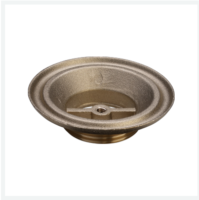
Ventilunterteil Modell 7121-667