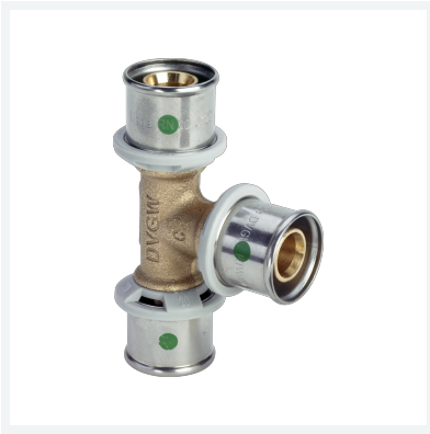
Sanfix P-T-Stück mit SC-Contour - Pressanschlüsse Modell 2118